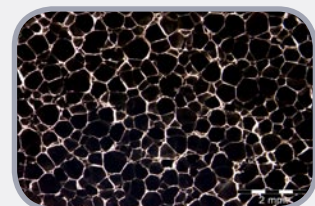
De nieuwe microcelstructuur van SH/Armaflex